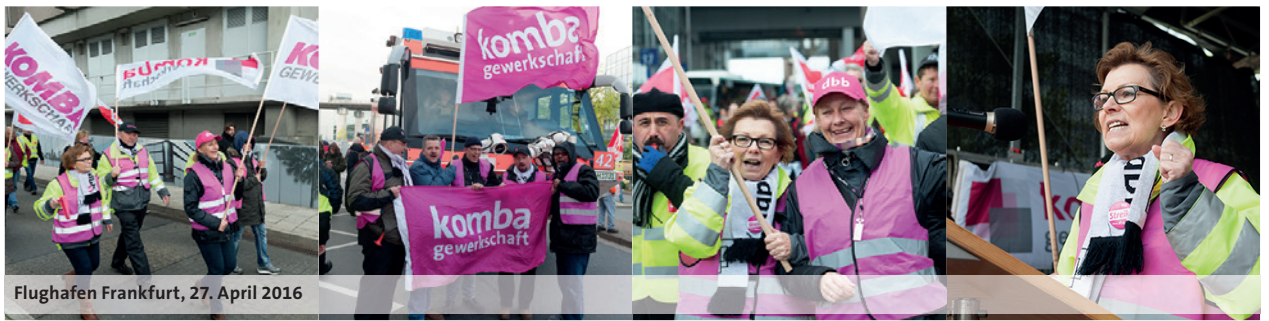
Flughafen Frankfurt, 27. April 2016