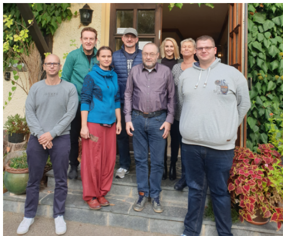
Tarifkommission Rettungsdienst MOL, Foto: dbb

Die Forderungen der Mitarbeitenden wurden ausführlich besprochen. Unter anderem wurde der neue Rollendienstplan ab dem Jahr 2020 thematisiert. Die daraus folgende Mehrbelastung der Mitarbeitenden muss durch konkrete Verbesserungen kompensiert werden. Auch die Flexibilität der Arbeitszeit war erneut Thema. Aufgrund der Änderungen, die in nächster Zeit auf den Rettungsdienst MOL zukommen, muss der Tarifvertrag entsprechend angepasst werden.