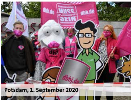
Potsdam, 1. September 2020