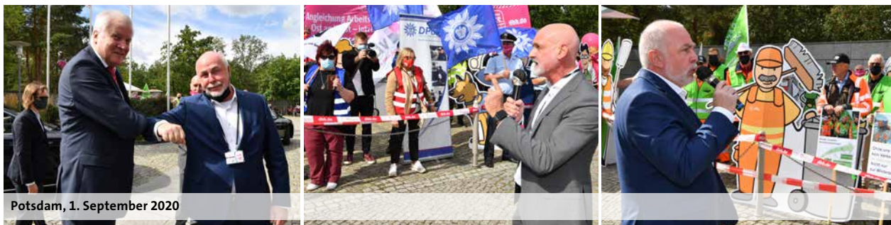
Potsdam, 1. September 2020